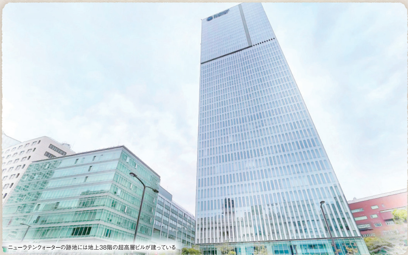
ニューラテンクォーターの跡地には地上38階の超高層ビルが建っている