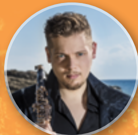
コハーン・イシュトヴァーン (クラリネット)