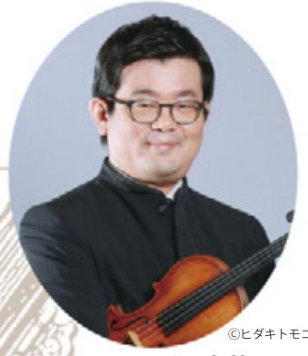
ヴァイオリン 千々岩英一 Eiichi Chijiwa, solo violin II