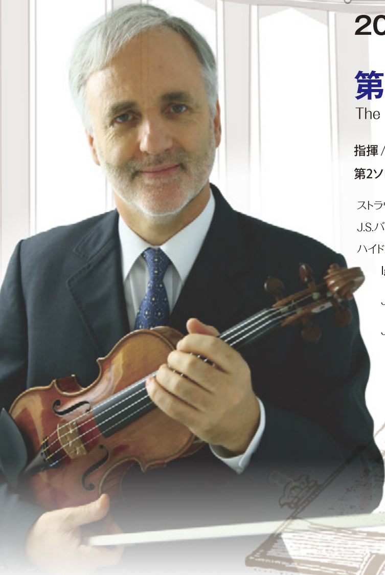
指揮・ヴァイオリン ライナー・ホーネック Rainer Honeck, Conductor, solo violin I

The Seven Last Words of Our Saviour on the Cross, Hob.XX/1A