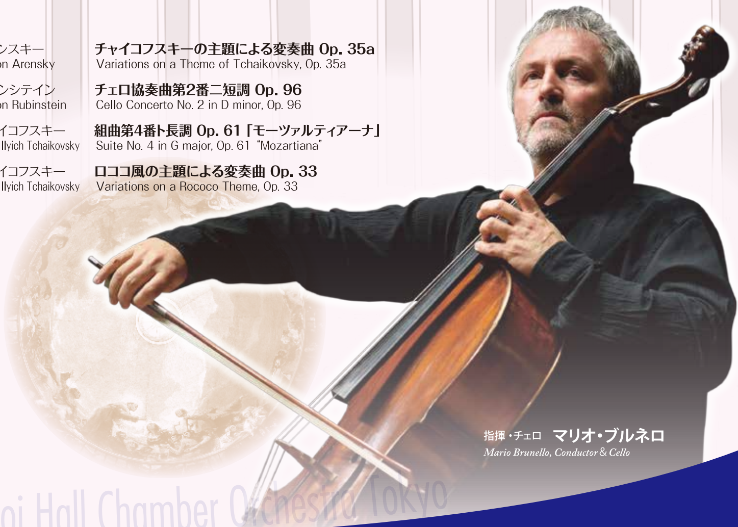
指揮・チェロ マリオ・ブルネロ Mario Brunello, Conductor & Cello

ロココ風の主題による変奏曲 Op. 33 Variations on a Rococo Theme, Op. 33