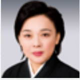
たけもとこうしこう 竹本越孝 (義太夫)

ハンガリー出身のクラリネット・ソリスト。音楽一家に生まれ、幼少の頃から数々の国際コンクールで優勝する。リスト音楽院卒業後の2013年に活動拠点を日本に移した。東京音楽コンクール、日本音楽コンクール等において第1位及び副賞多数受賞。ハンガリー芸術賞受賞。青山音楽賞受賞。東京音楽大学、尚美学園大学講師。