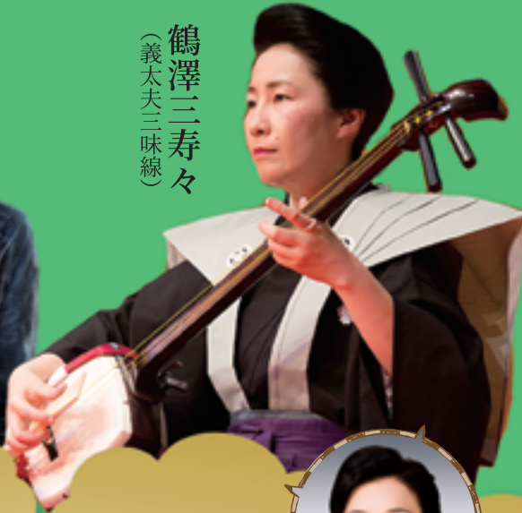
鶴澤三寿々 (義太夫三味線)