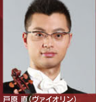
戸原 直(ヴァイオリン)