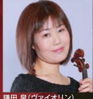
鎌田 泉(ヴァイオリン)