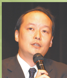
◆案内人 児玉竜一 (早稲田大学文学学術院教授)