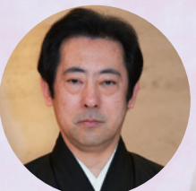
梅若紀彰 能楽シテ方