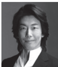
彌勒忠史 総指揮・脚本

音楽、絵画、彫刻、文学など、古今あらゆる西洋芸術に登場する人気者、愛の神アマモレ。キューピッドの名でも知られ、一般には羽の生えた裸の幼児の姿が有名です。しかしそんな愛らしい外見とはうらはらに、強大な力を持つ彼の金の矢に射られた者は、それが人であろうと神であろうと、あっという間に恋に落ちてしまうのです。