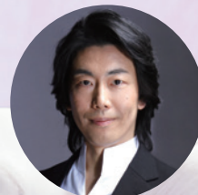
制作総指揮・脚本 彌勒忠史

友の会優先発売 9月4日(水) 一般発売 9月7日(土) ともに紀尾井ホールウェブチケット午前0時～/電話午前10時～