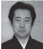
梅若紀彰 能楽シテ方