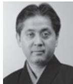
観世喜正 能楽シテ方