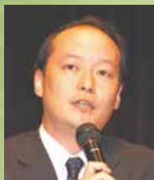
◆案内人 児玉竜一 (早稲田大学文学学術院教授)