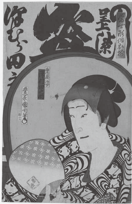
『当世形浴衣揃』 楽屋姿 澤村田之助

本シリーズで使用 する大谷コレク ションの浮世絵は、 美術をこよなく愛 した実業家大谷米 太郎氏の膨大な所 蔵品の中でも特筆 すべき物を使用し ております。