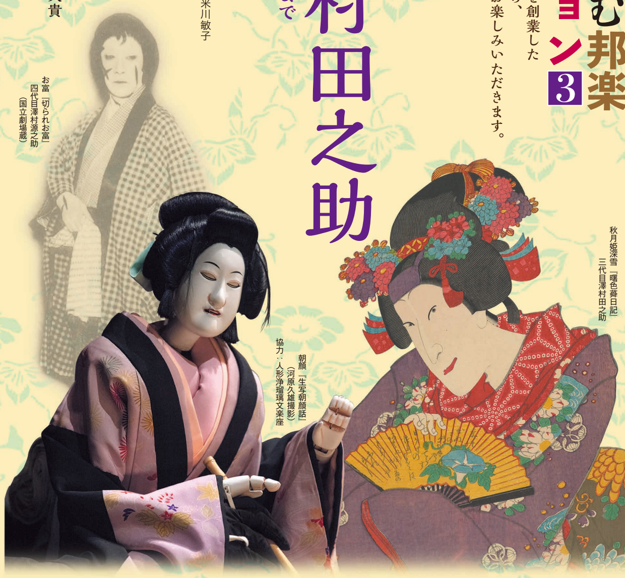
秋月姫深雪 曙色舞日記 三代目澤村田之助