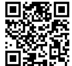
紀尾井ホールウェブ チケットにアクセス

紀尾井ホール室内管弦楽団の定期会員 A 「継続」 B 「席替」 C 「退会」は、 紀尾井ホールウェブチケットでお手続きください。