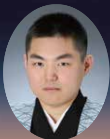
浄瑠璃 竹本碩太夫