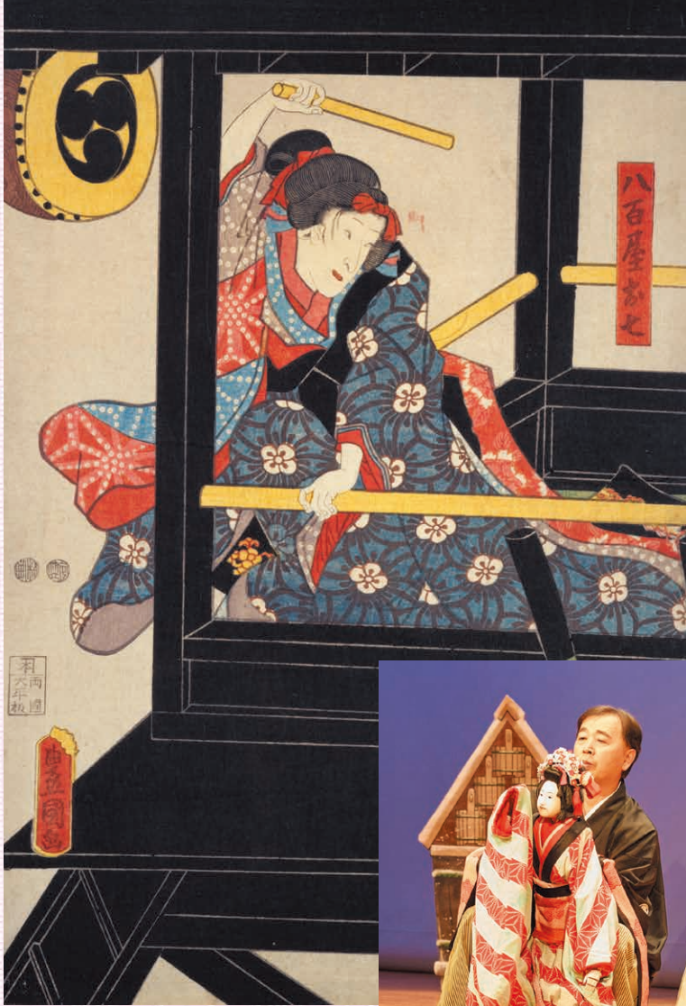
豊国『(火の見櫓の八百屋お七)』 国立国会図書館デジタルコレクション蔵