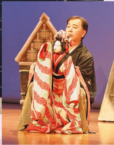
八王子車人形西川古柳座

江戸時代、当時世間を騒がせた実際の事件を元にして 井原西鶴が書いた浮世草子「好色五人女」 江戸本郷にある八百屋の娘が、恋人に会いたい一心で 放火事件を起こした悲劇の物語「八百屋お七」を 箏曲・清元・義太夫で描きます。