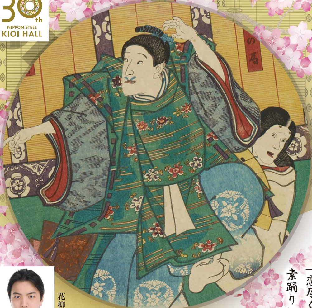
豊国画「秋の局」[文屋の康秀]101-6165(部分使用)早稲田大学演劇博物館所蔵