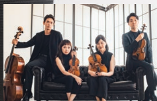
エウレカカルテット