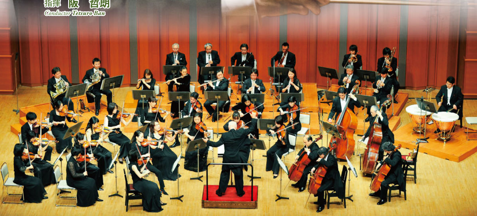
指揮 阪 哲朗 Conductor Tetsuro Ban