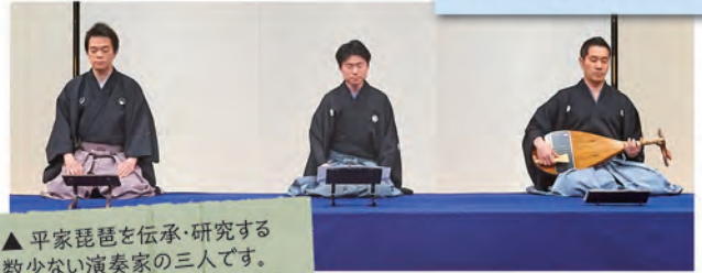
▲平家琵琶を伝承・研究する数少ない演奏家の三人です。これからの活躍が期待されます。

5.29 近松門左衛門作 鳥越文藏 発意・監修 鶴澤燕三 作曲 5.30 出世景清 素浄瑠璃公演