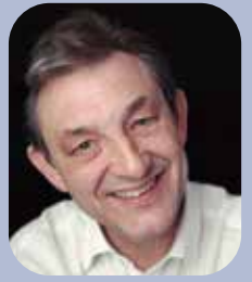
トレヴァー・ピノック

紀尾井ホールと紀尾井ホール室内管弦楽団(KCO)の創立25周年を迎える2020年は、主催公演も、KCOの定期演奏会もお祝いムードに包まれます。それだけでなく、直前の20年2月にも少しだけ20年度を先取りした開館25周年記念コンサート企画しました。それが、トレヴァー・ピノックとKCOによるモーツァルトプログラムです。この作曲家の生涯最後の傑作《レクイエム》と大ト短調交響曲というセレクトは、祝祭的というにはいささか重厚ですが、作品そのものの充実と深さでもって25周年を飾ろうというピノックの意気込みが伝わってきます。そして《アヴェ・ヴェルム・コルプス》はまさに美しきの極み。その旋律は昨年のKCO定期でブルネロが採り上げたチャイコフスキーの《モーツァルティアーナ》にも引用されており、前年からの繋がりも感じられます。