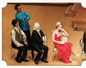
◀「ブルチネルラ」のひとコマ。土曜公演ではマエストロが歌手陣に交ざってお芝居する場面も!