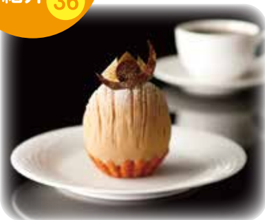
スーパーモンブラン