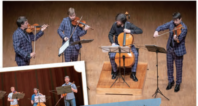
◀本番前のリハーサル中。気さくで明るいメンバーの皆さんです。