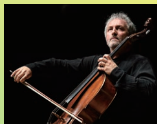
マリオ・ブルネロ