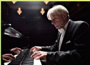
ペーター・レーゼル

ドイツ・ピアノの伝統を継ぐ名匠の日本ラスト・コンサート。 2007年に紀尾井ホール・リサイタル・デビューを飾った あの名プログラムを再び日本の皆さまに贈ります。