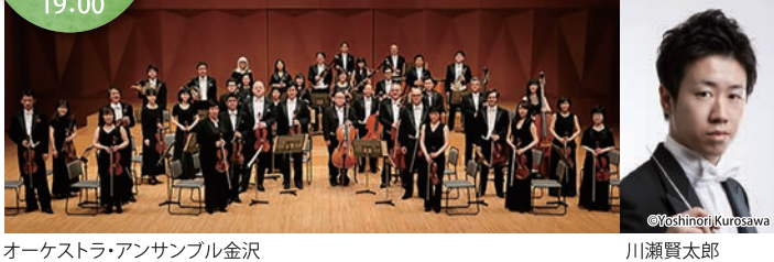
オーケストラ・アンサンブル金沢