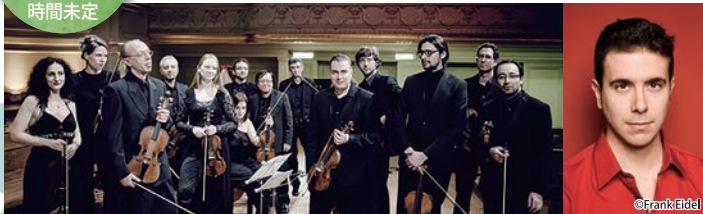
イル・ポモドーロ