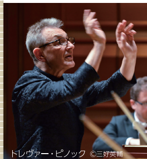
トレヴァー・ピノック

ピノックが紀尾井ホールと紀尾井ホール室内管弦楽団(KCO)の創立25周年を祝うために、4年ぶりに帰ってきます。アニヴァーサリーに彼が用意したプログラムは、実に8年ぶりとなるモーツァルト。それも大ト短調と交響曲第40番と、絶筆となった《レクイエム》という、この作曲家の中でも特別にドラマティックな2作品に、美しさの極みのような《アヴェ・ヴェルム・コルプス》と、耳のご馳走とも言うべき名作中の名作を取り揃えました。古典作品に絶対の定評のあるピノックと、ふくよかな音色と研ぎ澄まされたアンサンブルを同居させるKCOとの絶妙なタッグによる演奏でお楽しみください。