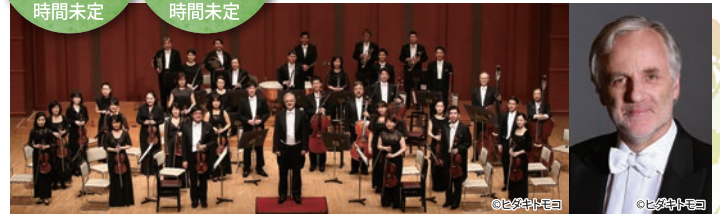
紀尾井ホール室内管弦楽団