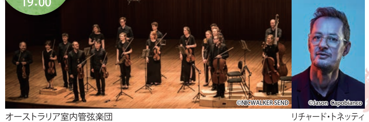
オーストラリア室内管弦楽団