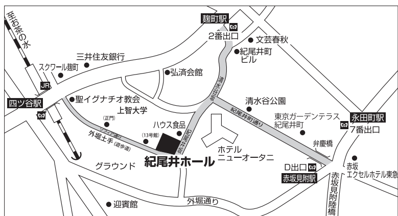
紀尾井ホールへの案内図